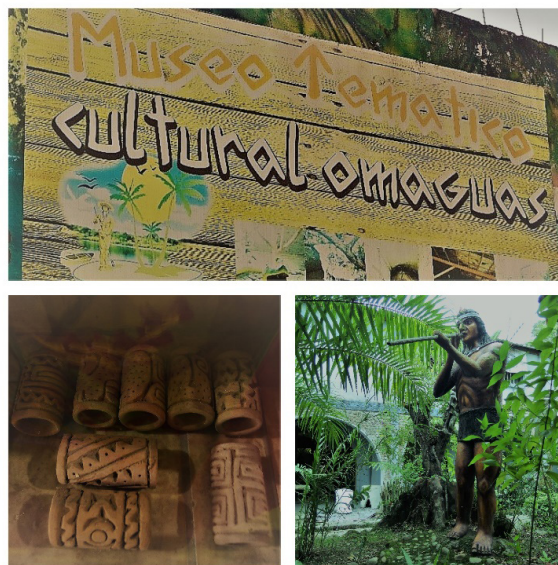
Figura 7. Reclamo turístico

En Ecuador, el éxito de la identidad omagua como “recurso” es producto del trabajo desarrollado en los últimos años por la misión capuchina de origen navarro (norte de España) de revalorización del “tiesto muerto”: recuperación, conservación y difusión de vasijas de la Fase Napo, asociada a los omaguas históricos. La “marca” omagua es un efecto “colateral”. Se puede apuntar aquí el papel realizado por los capuchinos desde el Centro de investigación cultural de la Amazonia ecuatoriana (CICAME), fundado en 1965, desde el Museo de Pompeya (convertido en etnográfico en 2009) o, más recientemente (2015), desde el Museo Arqueológico y Centro Cultural de Orellana (MACCO), con fuerte inversión pública del Municipio (Figura 8).