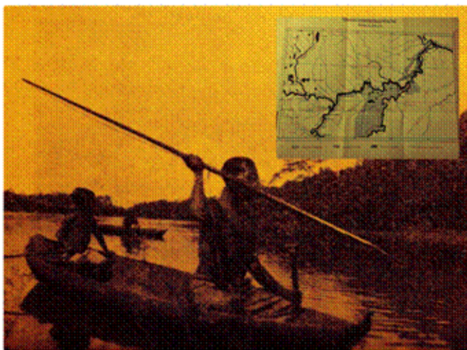
Figura 2. Omaguas pescando, con detalle mapa de distribución de los tupí en Perú en los años treinta del siglo XX

Igualmente, explica el origen de su ubicación (Ibíd., 288): “[...] dos pueblos de Omaguas en el territorio del Perú: San Joaquín y San Salvador, que se formaron con los restos de los Omaguas fugitivos de los portugueses en tiempos del Padre Samuel Fritz”. Cabe subrayar que los enclaves actuales son producto de las misiones y, por tanto, de una mezcla importante de culturas junto con la omagua: pevas, caumaris, mayorunas, yurimaguas, miguianos, amaonos, masamaes, cocamas, y cocamillas.