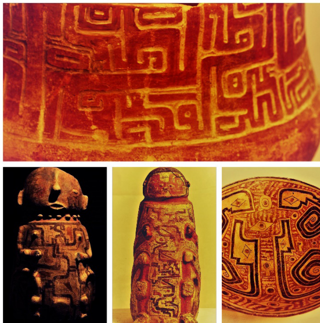
Figura 3. Piezas Fase Napo