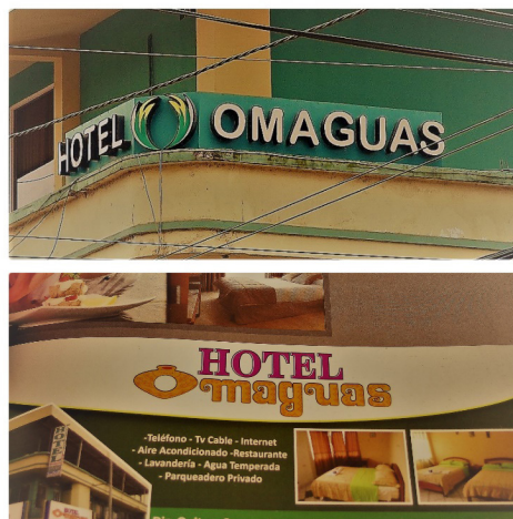
Figura 6. Recurso y marca cultural

Esta construcción identitaria o, más concretamente, esta reconstitución cultural en base a fragmentos provenientes de lo que se podría citar como un etnocidio, que dan sentido de pertenencia y de la propia existencia, tiene otros vericuetos en Ecuador, en ciudades de colonización reciente, teniendo como protagonistas tanto los colonos blanco-mestizos, como los indígenas de habla kichwa. Un caso paradigmático se da en Puerto Francisco de Orellana (más conocida como “El Coca” ), capital de la provincia de Orellana, en la Amazonia ecuatoriana. Allí se puede encontrar el “Hotel Omaguas” , nombre que denota apropiación y orgullo de los ancestros directos o adscritos que ocuparon esas tierras (Figura 6). O las Piscinas Pauker y Museo temático cultural omaguas (Figura 7), cuyo propietario es hijo de una familia de colonos y promotor turístico. “Lo omagua” , en El Coca, utilizando la perspectiva de Yúdice (2002), sería más bien un “recurso” cultural en el marco de las nuevas oportunidades que ofrece el mercado turístico gracias al incremento del flujo de personas en el mundo globalizado del capitalismo avanzado. Un turismo que busca lo diferente, lo autóctono, lo “auténtico” .