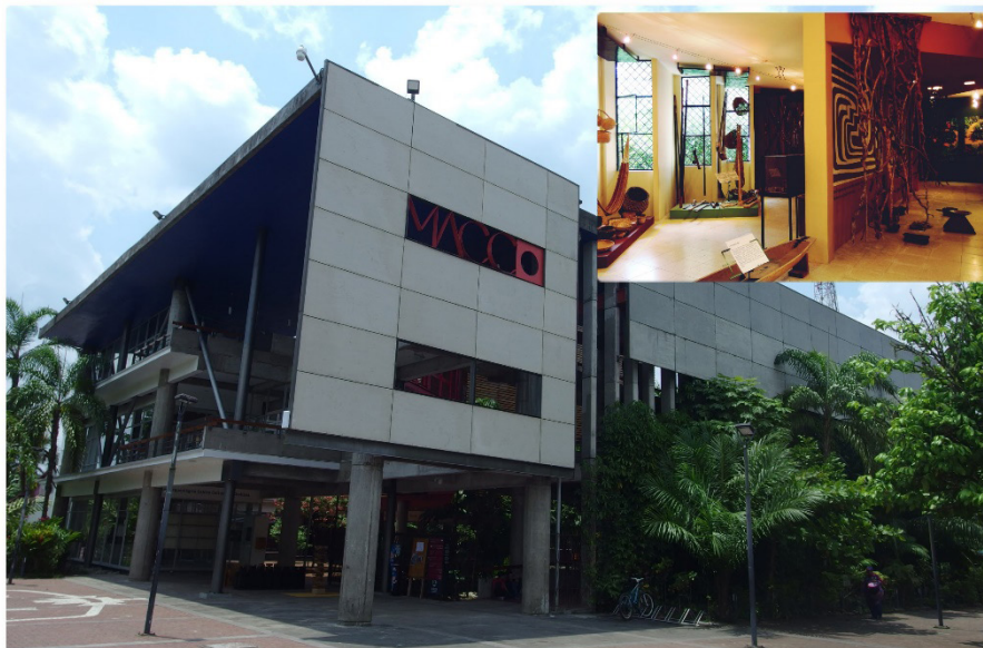
Figura 8. MACCO, en Puerto Francisco de Orellana (“El Coca”), y detalle del Museo del CICAME en la isla de Pompeya (Napo ecuatoriano)

Para algunos indígenas actuales el miedo a la vasija con restos mortuorios se compagina, o ha dado paso, al orgullo de los ancestros. Un orgullo influenciado por la Iglesia misionera que debe aunarse, a menudo como retroalimentación, al que emana del movimiento social indígena. Desde por lo menos mediados de los setenta, y especialmente desde los ochenta y noventa, en varios países de Latinoamérica, este movimiento étnico, además de los avances en derechos colectivos e individuales (Constituciones de 1998 y 2008 en Ecuador), en vistas a una verdadera “ciudadanía intercultural” (Cabrero, 2013), imprime una revaloración general de lo autóctono como original o puro.