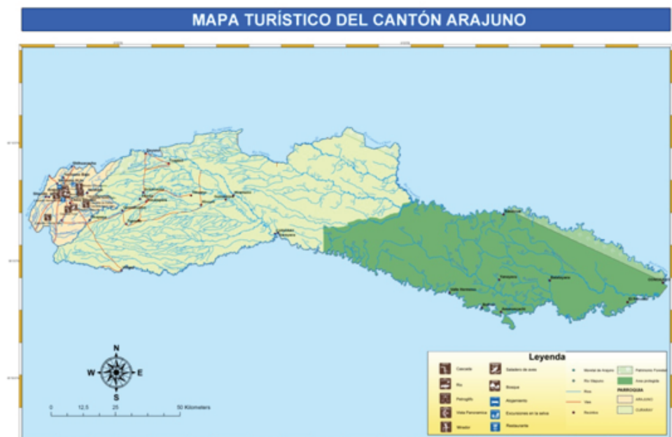
Figura 2: Mapa turístico del cantón Arajuno